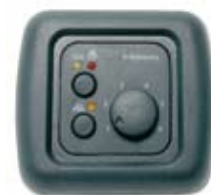
Diesel Cooker X 100 Bedienelement