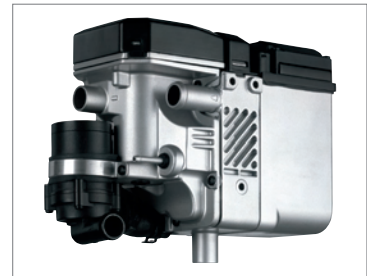
Thermo Top C Motorcaravan